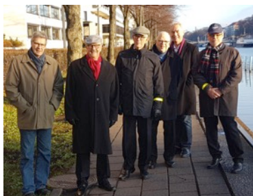
Bröder på besök i Åbo...