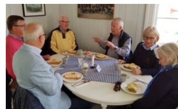
Kondisbröderna, med damer på besök på Wira Bruk...