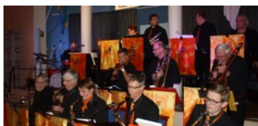
Inget riktigt kalas utan ett äkta storband...

Jag är nu inne på mitt andra år som Övermästare. Det har varit en intensiv tid på många sätt.